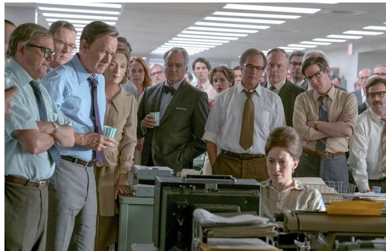
Steven Spielberg's "The Post"